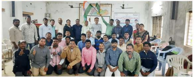
పాడేరు పీఠాన్ని శిక్షణ పొందుతున్న ఉపాధ్యాయులు