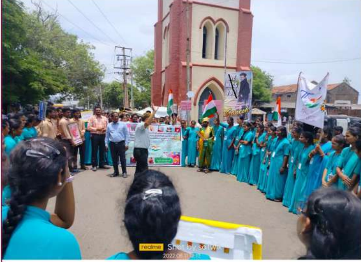
realme Shot by SCL W... 2022/08/11 11:17