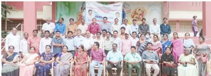
జ.ప. ఉన్నత పాఠశాల, వేపగుంట లో శిక్షణ పొందుతున్న ఉపాధ్యాయులు