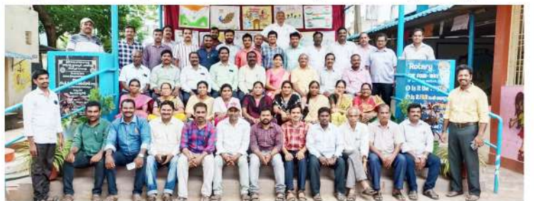
అనకాపల్లి జి.పి.యమ్.సి టౌన్ గర్ల్స్ హై స్కూల్ లో శిక్షణ పొందుతున్న ఉపాధ్యాయులు