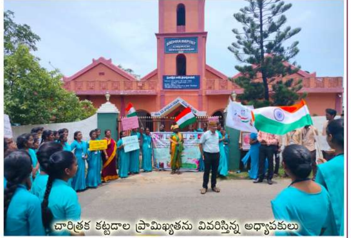
చారిత్రక కట్టడాల ప్రామిఖ్యతను వివరిస్తూ అధ్యాపకులు