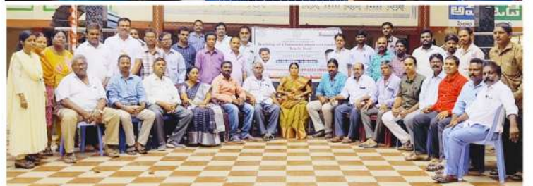
నర్సపట్నం జ.ప. ఉన్నత పాఠశాల (మాయిన్)లో శిక్షణ పొందుతున్న ఉపాధ్యాయులు