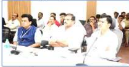
At 3 pm principal secretary sir participated in state level video conference along with Hon'ble

class. When checked the workbooks it is found that only 2 students work book is correct. The present teacher has said that the chapter has been dealt by the previous teacher. He has been working in the school since January 23. Sir has instructed to frame charges against the teacher.