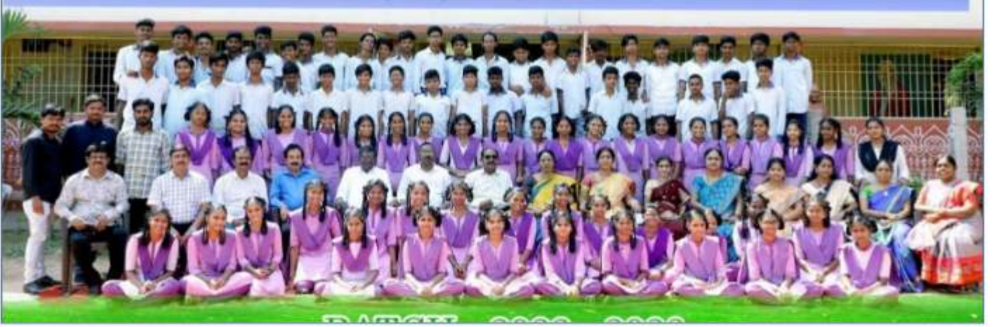
ZPHS, Adavivaram, Chinagadili mandal, Visakhapatnam dt

పదవ తరగతి పబ్లిక్ పరీక్షలు రాస్తున్న మన విద్యార్థులు అందరకు అభినందనలు. మీయొక్క విజయాలతో మన జిల్లాలకు గుర్తింపు తీసుకువస్తారని ఆశిస్తున్నాము. ఆల్ ద బెస్ట్ ..... ప్రభుత్వ డైట్ ప్రిన్సిపాల్, అధ్యాపకులు మరియు సిబ్బంది.