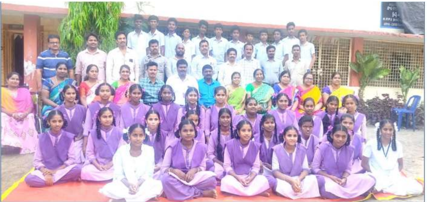
ZPHS, Chettupalli, Narsipatnam mandal, Anakapalli dt.