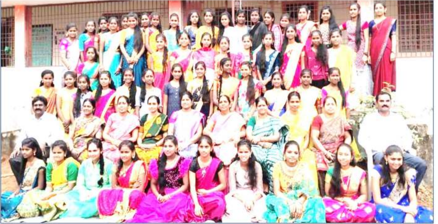
ZPHS, Ravikamatham, Anakapalli dt.