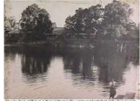
Chanderi Tank of Bhopal in Bhopal District. It is considered a historical site and was built by Dr. Ambedkar for enforcing the rights of the Untouchables to access the public tanks.

సత్యాగ్రహం కంటే ముందే నిమ్న కులాలకు త్రాగే నీటికోసం అంబేద్కర్ చేసిన పోరాటమును చరిత్రకారులు మరుగున పడేసారు. త్రాగే నీటికోసం స్వదేశీయులతోనే పోరాడవలసివచ్చింది.