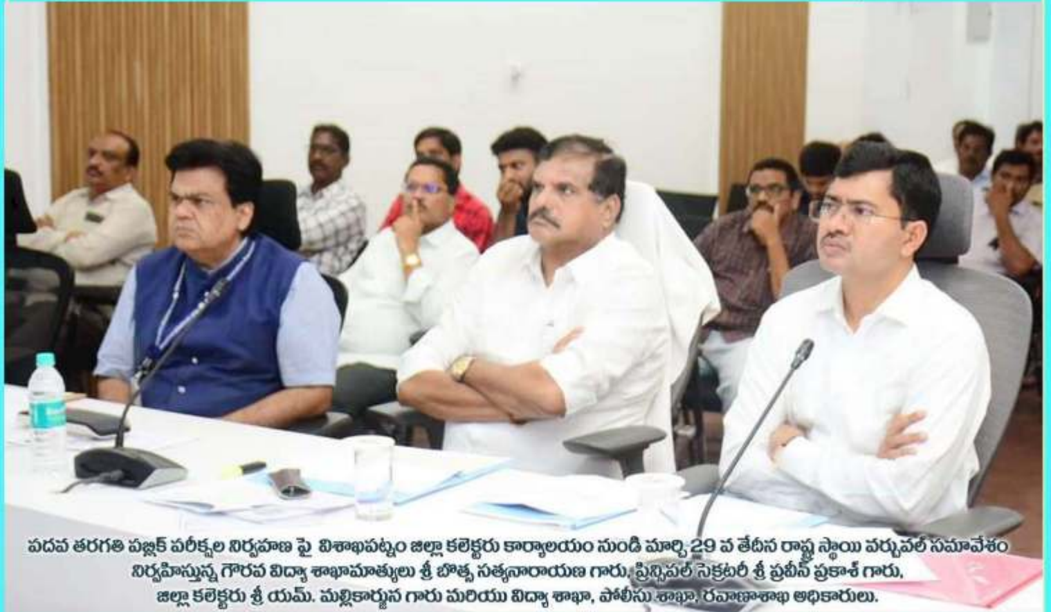
పదవ తరగతి పబ్లిక్ పరీక్షల నిర్వహణ పై విశాఖపట్నం జిల్లా కలెక్టరు కార్యాలయం నుండి మార్చి 29 వ తేదీన రాష్ట్ర స్థాయి వర్చువల్ సమావేశం నిర్వహిస్తున్న గౌరవ విద్యా శాఖామాత్యులు శ్రీ బొత్త సత్యనారాయణ గారు, ప్రీన్సిపల్ సెక్రటరీ శ్రీ ప్రవీణ ప్రకాశ్ గారు, జిల్లా కలెక్టరు శ్రీ యమ్. మల్లికార్జున గారు మరియు విద్యా శాఖా, పోలీసు శాఖా, రవాణాశాఖ అధికారులు.