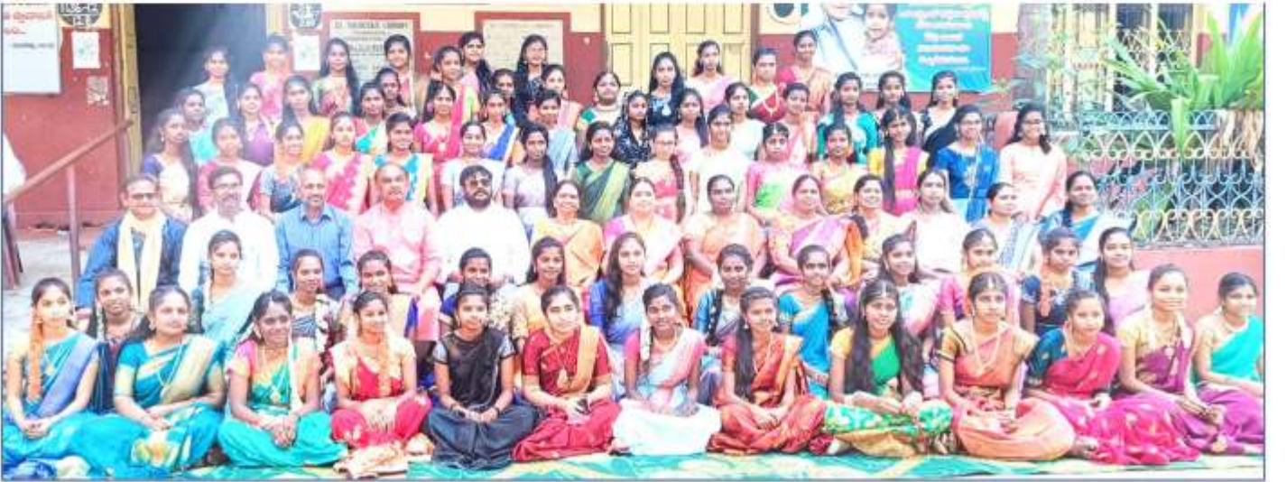
ZPHS, Peda boddepaalli, Narsipatnam mandal, Anakapalli dt.