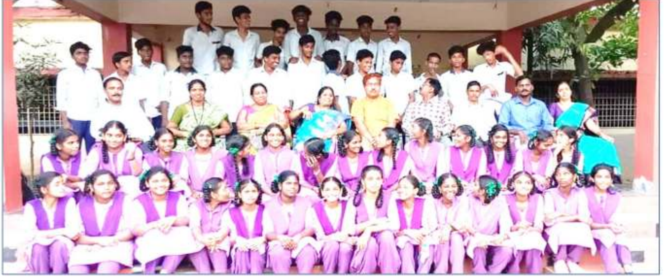
ZPHS, Nadupuru, Pedagantyada mandal, Visakhapatnam dt.