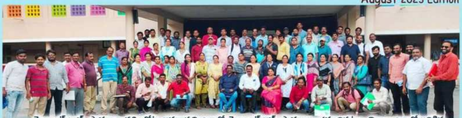
సెయింట్ జాన్స్ పాఠశాల, కశింకోట, అనకాపల్లి జిల్లాలో, సెయింట్ ఆన్స్ పాఠశాల, భమునిపట్నం, విశాఖ జిల్లాలో జరిగిన జవన నైపుణ్యాల శిక్షణ లో పాల్గొన్న వ్యాయామ మరియు డియార్టీ ఉపాధ్యాయులు.