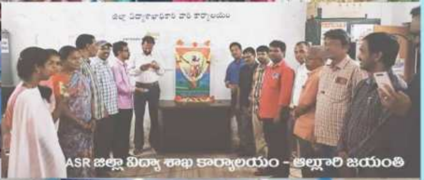
ASR జిల్లా విద్యా శాఖ కార్యాలయం - ఆల్లూరి జయంతి