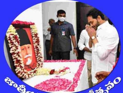
జాతీయ విద్యా దినోత్సవం