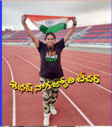
శ్రేణి నాగ జ్యోతి తీవర్